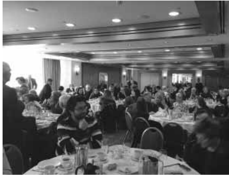
Η μεγάλη ανταπόκριση του κόσμου είναι φανερή στις φωτογραφίες από τη Γεν. Συνέλευση

Κατά την περσινή Γενική Συνέλευση, παρατηρήθηκε μειωμένη προσέλευση των μελών μας και είχε τεθεί ζήτημα για την ανταπόκριση των μελών στα καλέσματα του Συλλόγου και για το μέλλον του. Εκ του λόγου αυτού, θέσαμε ως στόχο μας τη συγκέντρωση περισσότερων μελών κατά πρώτον στην Γενική Συνέλευση και γενικότερα τη συνέχιση διοργανώ-