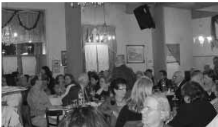
Μεγάλη η ανταπόκριση των φίλων και μελών του Συλλόγου