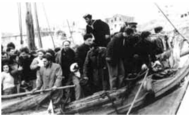
Η άφιξη στο λιμάνι της Ραφίνας.

Στις 19 Ιανουαρίου 1947, ώρα 1:30 το πρωί, το Χειμάρρα καταφθάνει στη Χαλκίδα όπου αποβιβάζει 10-15 επιβάτες και συνεχίζει το ταξίδι του προς τον Πειραιά. Ενώ ο πλοηγός του επιβατηγού συνεχίζεται μέσα στο πυκνό σκοτάδι της χειμωνιάτικης νύχτας, το κρύο έχει αρχίσει να γίνεται ιδιαίτερα τσουχτερό. Οι καμπίνες του πλοίου είναι γεμάτες