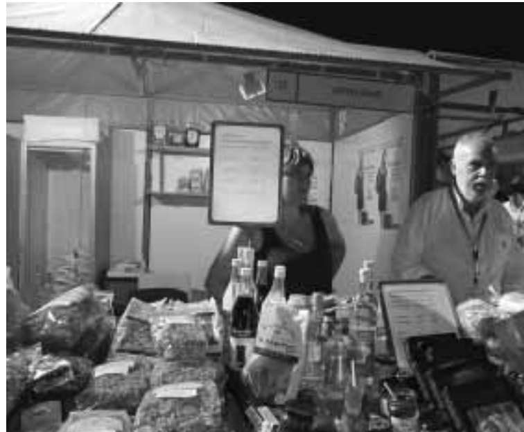
Ζυμαρικά και άλλα τοπικά προϊόντα παρουσιάστηκαν στην έκθεση

Το φεστιβάλ διοργανώθηκε από τον Ευρωπαϊκό Οργανισμό Στρατηγικού Σχεδιασμού υπό την αιγίδα του υπουργείου Αγροτικής Ανάπτυξης και Τροφίμων με στόχο την προώθηση της υγιεινής διατροφής και την ανάδειξη των προϋποθέσεων και των ελέγχων που οδηγούν στην παραγωγή προϊόντων ανώτερης ποιότητας. Παρουσιάστηκαν πιστοποιημένα προϊόντα της ελληνικής αγοράς και τονίστηκε η αναγκαιότητα κατανάλωσης ελληνικών προϊόντων.