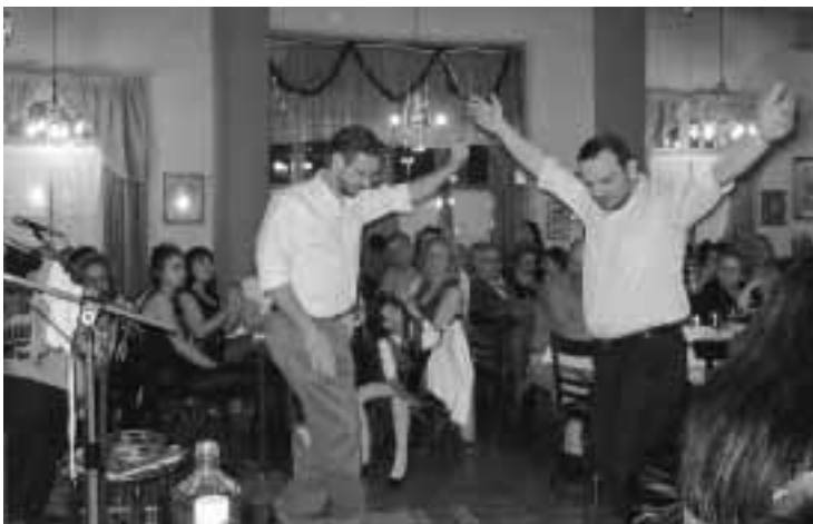
Το απτάλικο στην καλύτερη έκφρασή του από τα μέλη μας

Ευχαριστούμε επίσης όλους όσους προσέφεραν δώρα και συνέβαλαν αποφασιστικά στην επιτυχία της λαχειοφόρου αγοράς υπέρ του Συλλόγου.