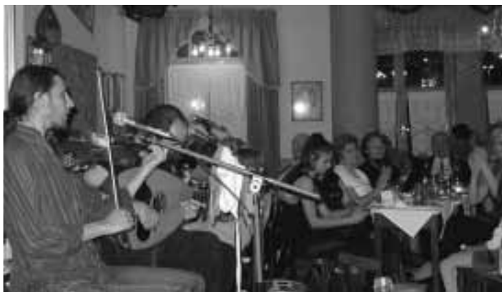
Πρωταγωνιστές τα παραδοσιακά όργανα