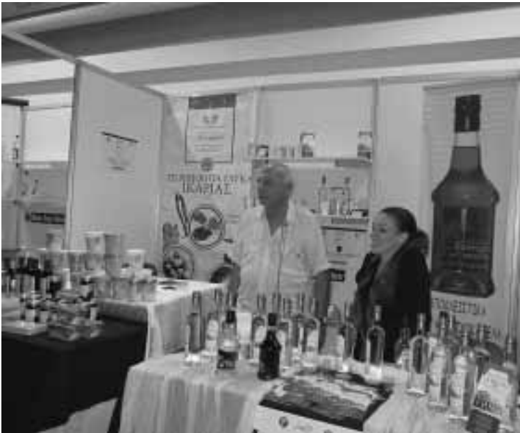
Γνωστή Ποτοποιία και προβολή του ηδύποτου «Μαστιχοκανέλλα»

Από 17 έως 19 Μαΐου 2103, στη Τεχνόπολη στο Γκάζι παρουσιάστηκαν στο κοινό αγροτικά προϊόντα από όλη την Ελλάδα στο πλαίσιο του 4ου Agro Quality Festival.