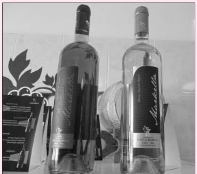
Τα δυο νέα κρασιά με την ονομασία «Μαρκέλλα»

Η παραγωγή βρίσκεται σε αυξανόμενη μορφή ενώ στο χώρο εξακολουθούν οι εικαστικές παρεμβάσεις των ιδιοκτητών, οι οποίες μετατρέπουν τις εγκαταστάσεις εκτός από χώρο παραγωγής και σε χώρο καλαίσθητο και αρκούτσως προσίτο στο κοινό. Εντύπωση μας έκανε το όμορο σιντριβάνι και κυρίως ο γέρικος κορμός ελιάς στον προαύλιο χώρο, ο οποίος στέκει ως γλυπτό στον ανοιχτό χώρο, χωρίς το φλοιό του με ένα υπέροχο οπτικό αποτέλεσμα.