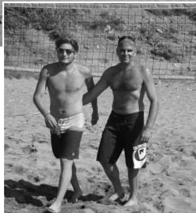
(Ανω) Η νικήτρια ομάδα σε δράση.