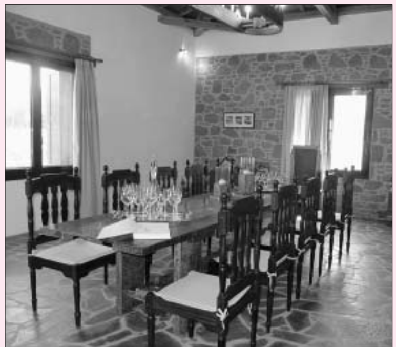
Η αίθουσα γευσιγνωσίας του Οινοποιείου

Θα αναφερθούμε για άλλη μια φορά στο οινοποιείο «Κεφάλα», γιατί πιστεύουμε ότι η ύπαρξή του χαρίζει στη Βολισσό φήμη και ότι τέτοιες προσπάθειες βοηθούν στην αξιοποίηση του τόπου.