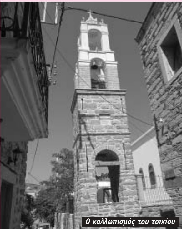
Ο καλλωπισμός του τοιχίου