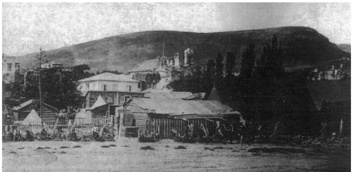
Η Πλατεία Βουνακίου με τα νοσοκομειακά παραπήγματα