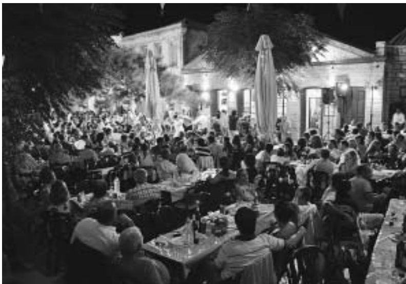
Πυθώνας: το πανηγύρι της Παναγίας

Η ανταπόκριση του κόσμου στο κάλεσμα αυτό είχε σαν αποτέλεσμα την επιτυχή διοργάνωση.