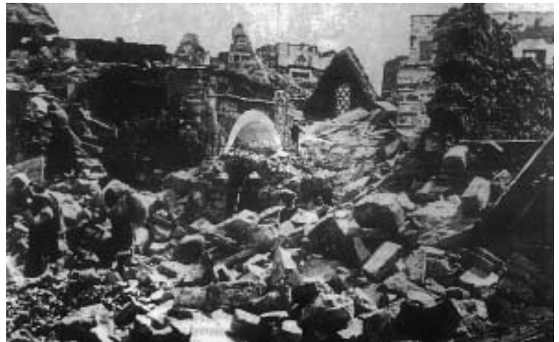
Χώρα. Η αγορά της πόλης (Απλωταριά)

Το Αιγαίο, είναι μια περιοχή με εφελκυστική τεκτονική που προκαλείται από την καταβύθιση της αφρικανικής πλάκας κάτω από την μικροπλάκα του και για αυτό θεωρείται από τις πιο σεισμογενείς περιοχές της Ευρώπης, μαζί με τον κόλπο της Σμύρνης.