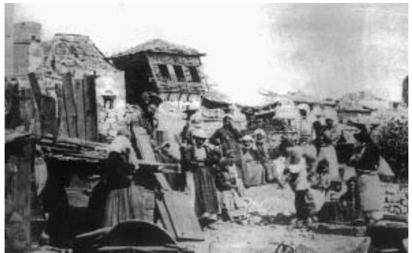
Οδός Εγκρεμού, Χίος