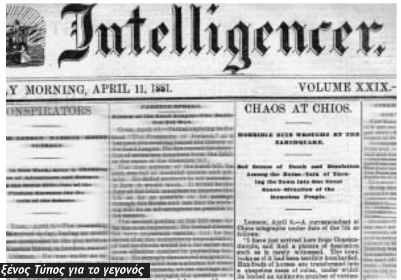
Ο ξένος Τύπος για το γεγονός