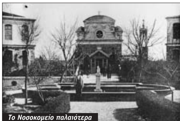
Το Νοσοκομείο παλαιότερα

- Η ένταξη του Γενικού Νοσοκομείου Χίου το 2001 στο Πε.Σ.Υ.Π. Βορείου Αιγαίου με την ίδρυση του Περιφερειακού Συστήματος Υγείας με το νόμο 2889/01.