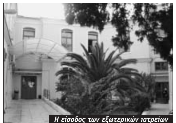
Η είσοδος των εξωτερικών ιατρείων