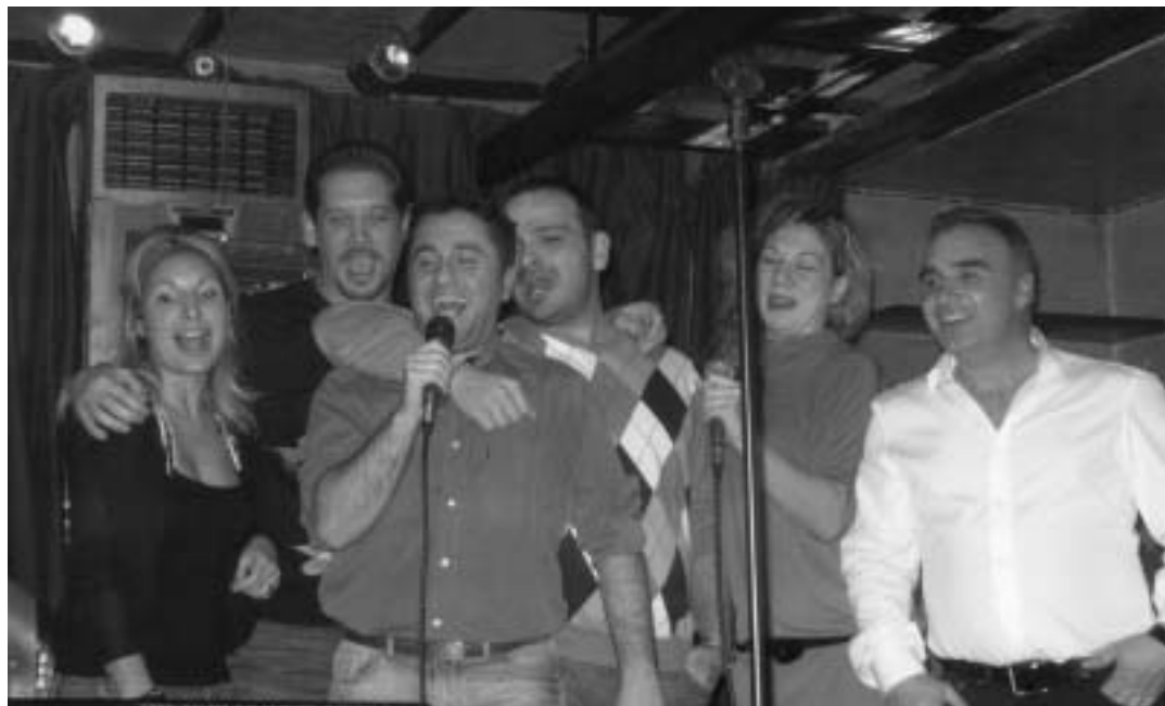
Το Δ.Σ. του Συλλόγου επί το... έργου